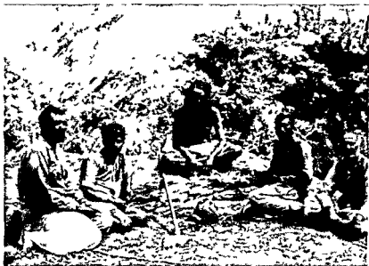
गरभ्याग के पूर्व एक हरेभरे स्थल पर दाता अपने चार सेवको के साथ